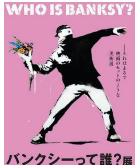
バンクシー 《ラヴ・イズ・イン・ジ・エア》 Love Is In The Air 2006年 個人蔵