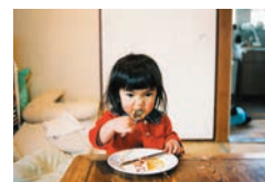
「未来ちゃん」©川島小鳥

川島小鳥は1980年東京都生まれ。2007年に友人を被写体とした写真集「BABY BABY」でデビュー。11年に、佐渡島で暮らす生命力あふれる3歳の少女を撮影した『未来ちゃん』で第42回講談社出版文化賞写真賞。15年に、3年をかけて台湾の人々をとらえた『明星』で第40回木村伊兵衛写真賞を受賞し、見る者を引き込むノスタルジックな世界観が評価される。一貫して人物を中心としてその周りにある風景を撮影し、瞬間瞬間をみずみずしく切り取る。デビューからこれまでの作品を総集編的に紹介し、若者に絶大な人気を誇る写真家の魅力に迫る。