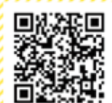
ニトリの感染症対策

※ご利用方法の 3 のログインに必要な ID とパスワード 全福センター会員ログイン ID : sh PW : zenpuku